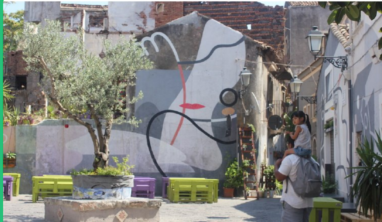
Street art Catania San Berillo district.